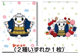
ゆげおオリジナルクリアファイル (2種いずれか1枚)

スタンプを5個集めた方には、「ゆげおオリジナルクリアファイル(2種いずれか1枚)」または「飯坂温泉オリジナル絆創膏(5枚セット)」をプレゼント!!