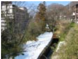
西根堰上堰用水路 川沿いに作られた堰が川岸の景観を守った