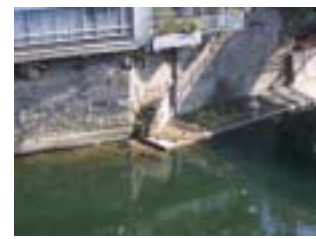
摺上川にある階段 川の水と人とのつながり