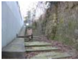
チャンコチャンコ(石段)と石積 特徴のある石