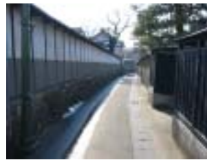
常泉寺の裏の通りと照明 風情のある通路