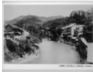
十綱橋より望む摺上川 (明治時代)