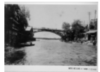
疝気の湯(左側)と十綱橋 (大正時代)