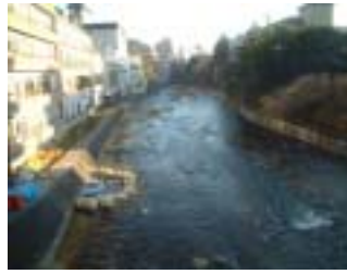
中十綱橋から摺上川下流を望む