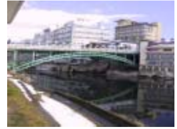
摺上川下流から十綱橋を望む