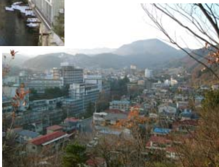
愛宕山から飯坂温泉街を望む