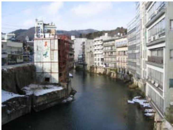
十綱橋から摺上川上流を望む