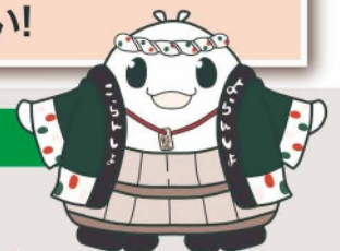
飯坂町マスコットキャラクター ゆげお