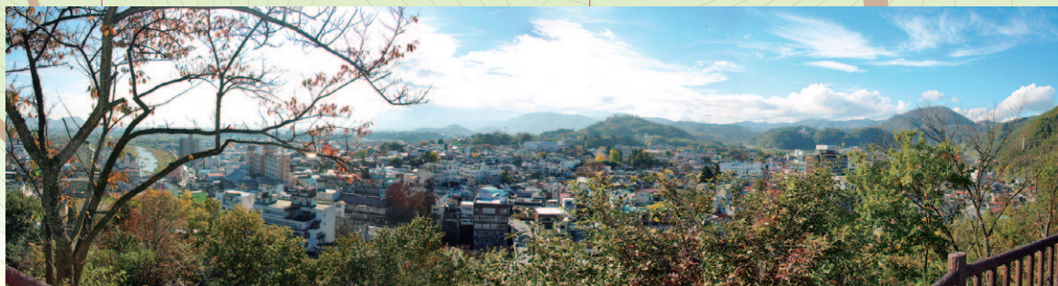
愛宕神社からは飯坂温泉街が一望できる

「ちゃんこちゃんこ下りて わたしや河原へ…」 飯坂小唄の中で歌われている「ちゃんこちゃんこ」とは、石の階段のことです。飯坂温泉はその名の通り、坂の多い温泉としても知られています。湯道坂、夜光院坂、沢坂…、坂の名が彫られた石柱を頼りに、坂道めぐりをするのも一興です。散策の後は、足湯や共同浴場で疲れを癒してください。