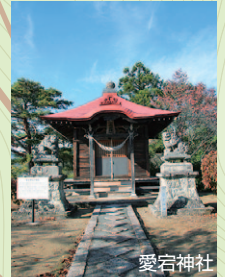
愛宕神社 ●宮本百合子の文学碑